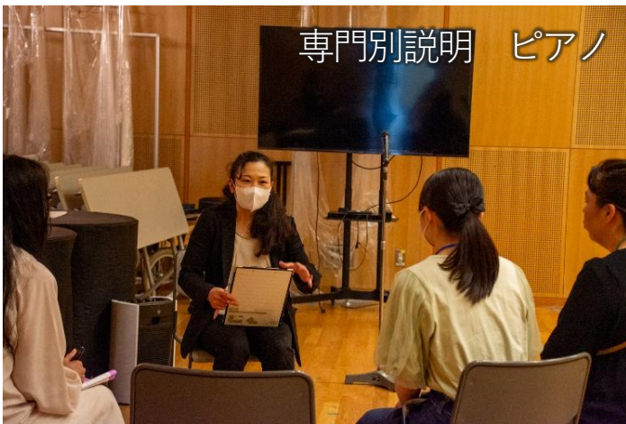
専門別説明 ピアノ